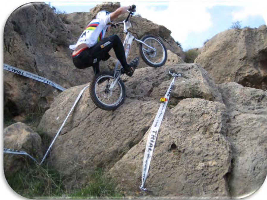
CAM. ESPAÑA LORCA - 2010 - ABEL MUSTIELES