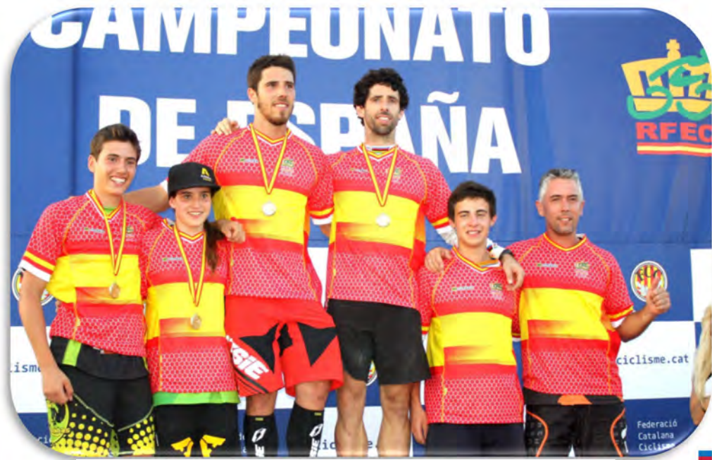
CAMPEONES DE ESPAÑA 2015 - TORREDEMBARRA (TARRAGONA)

CAMPEONATO DE ESPAÑA TRIAL 2016 LORCA (MURCIA)